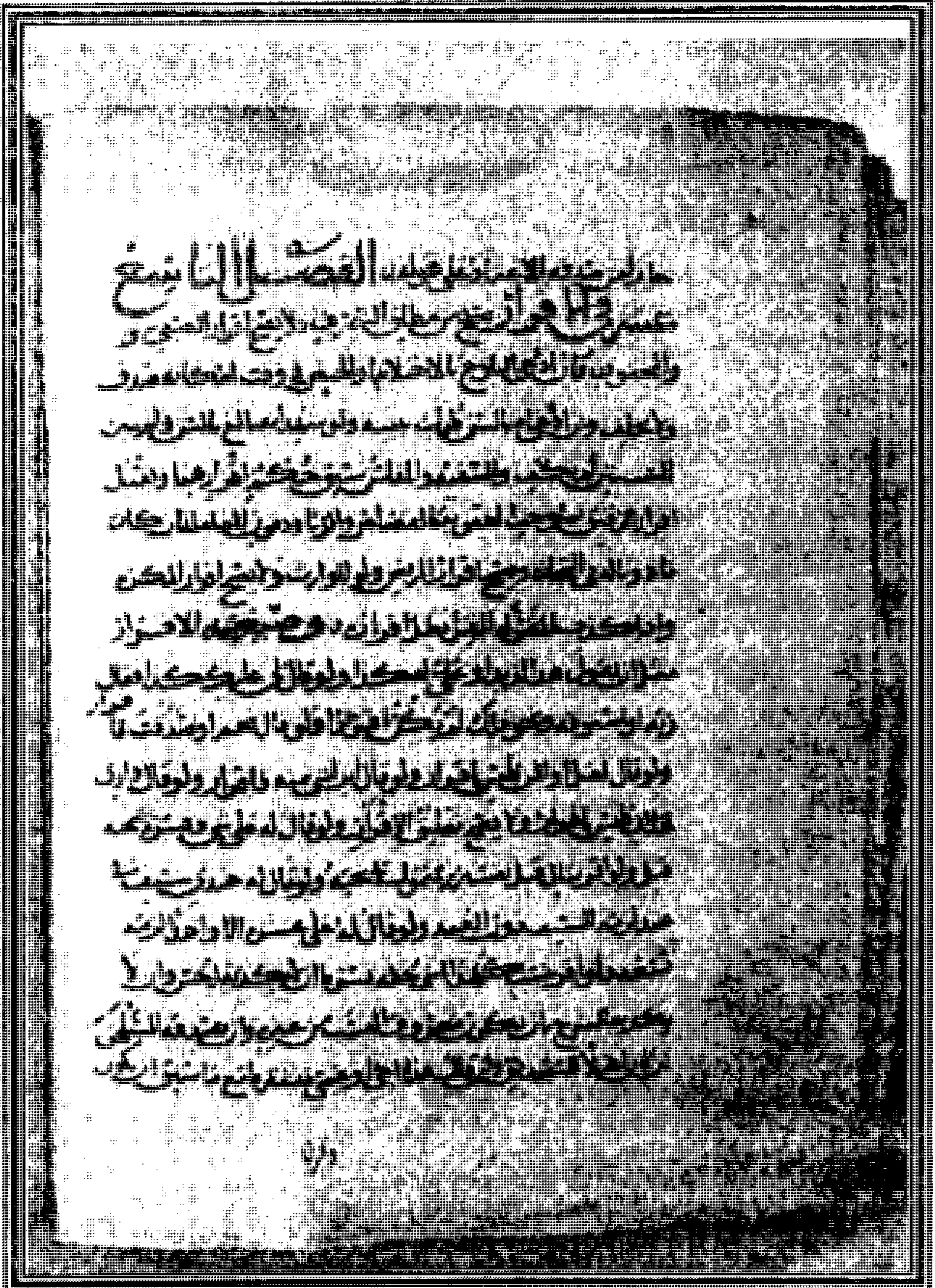
صورة من مخطوطة كتاب مختصر الأنوار الذي شرح الشيخ منه بابي الصلح والإقرار